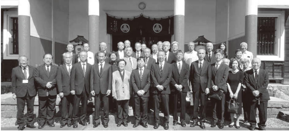
参列者の皆様と榮涼寺本堂前にて