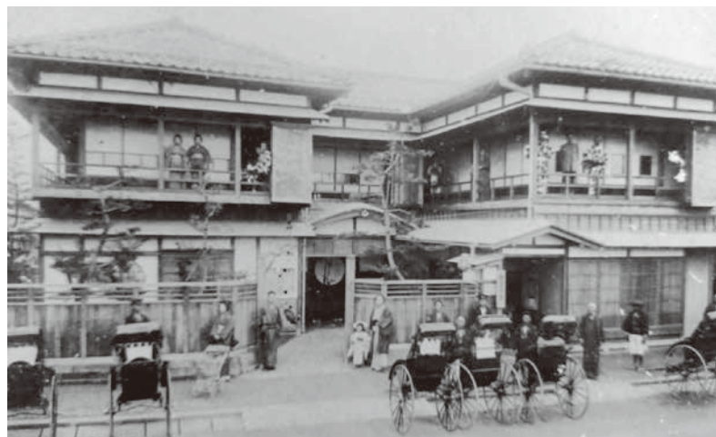
古町6番町にあった「くし清旅館」